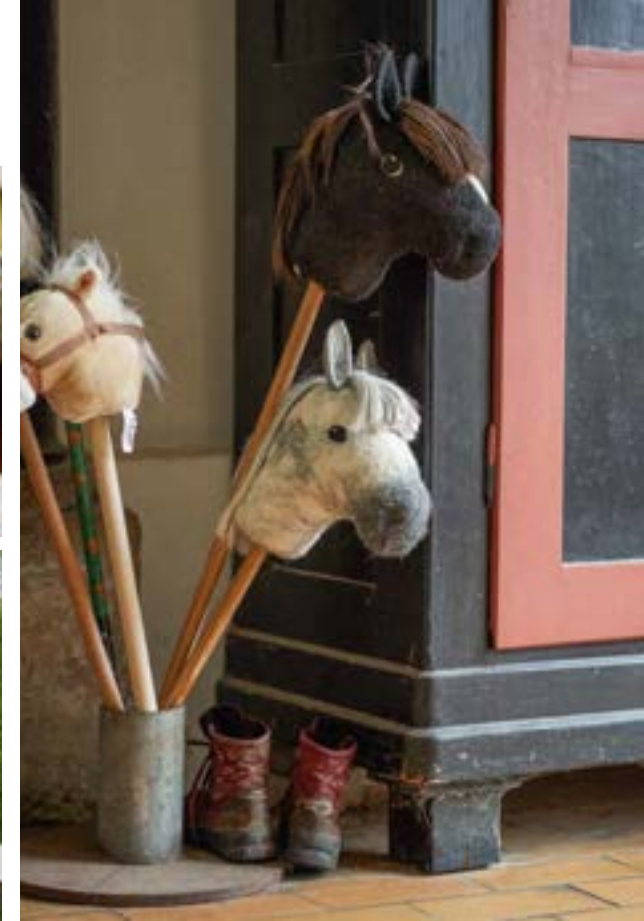
Von der Sommerresidenz einer Witwe zum Sommeridyll für Reiter